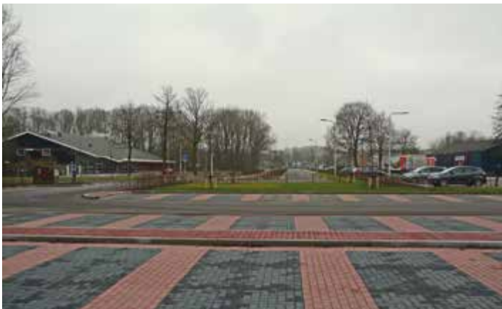
▲ Impensie van het pas gerenoveerde parkeerterrein in Dronten.